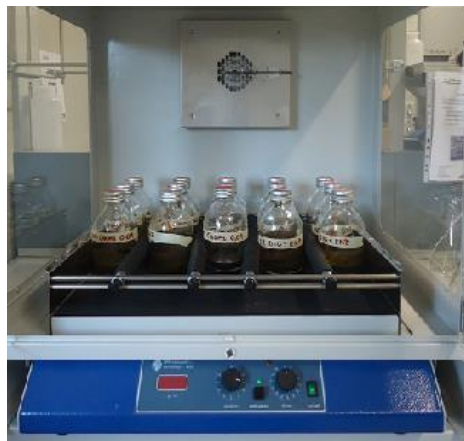
Figura 2: Prove di confronto tra matrici tal quali e pretrattate.